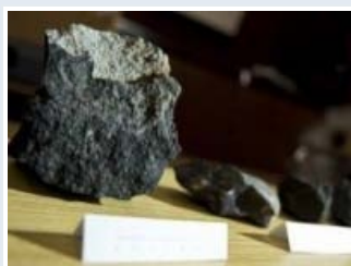
najväčší úlomok meteoritu, prezentovaný v Starej Lesnej .

AKTUALIZOVANÉ: Prvý úlomok meteoritu, ktorý 28. februára preletel zemskou atmosférou, našli pracovníci Slovenskej akadémie vied, Univerzity Komenského a Astronomického ústavu SAV 20. marca.